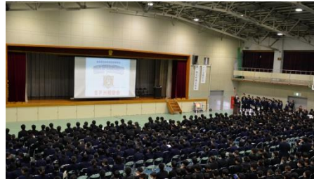
※株主総会（模擬実習）