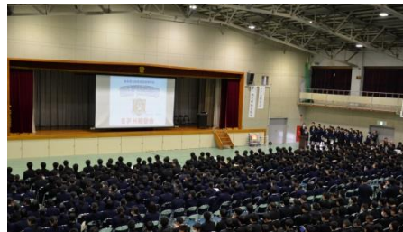
※株主総会（模擬実習）